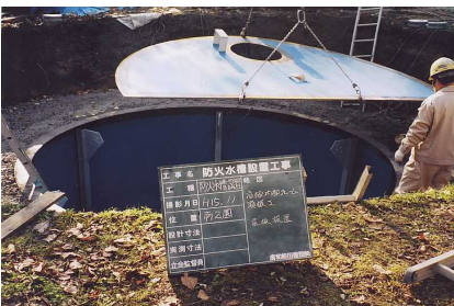
4 - 1 底板取り付け