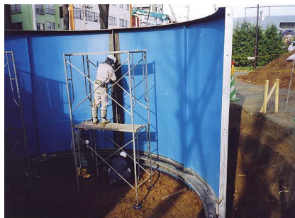
3 - 2 側板組立～溶接