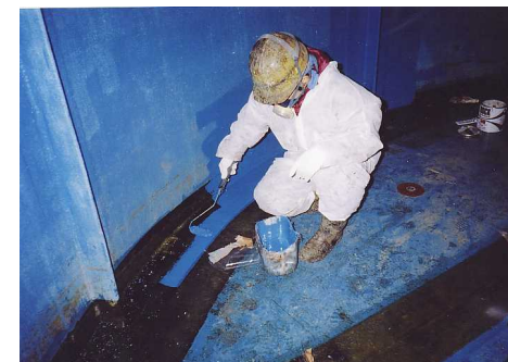
5 - 2 内面トップコーティング