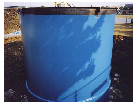
3 - 5 側板完成～掘削工程へ