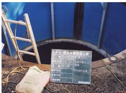
4 - 1 掘削後に基礎コンクリート およびレミファルト敷き