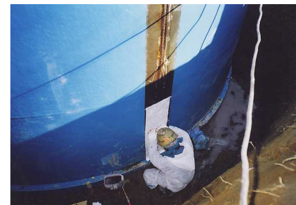
3 - 3 外面FRPコーティング(内面も同様に)