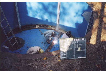
4 - 3 底板溶接