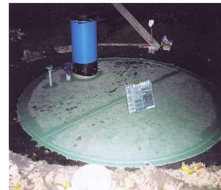
4 - 4 組立完了～頂版コンクリート～埋め戻し