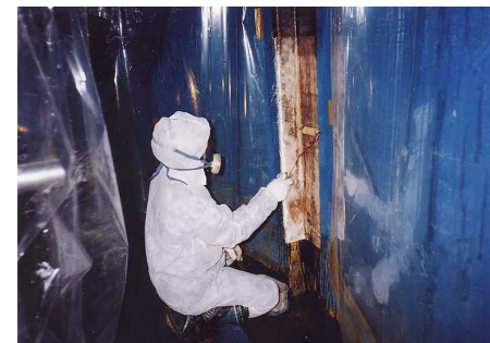
5 - 1 内面FRPコーティング