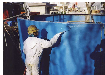
3 - 4 外面トップコーティング(内面も同様に)