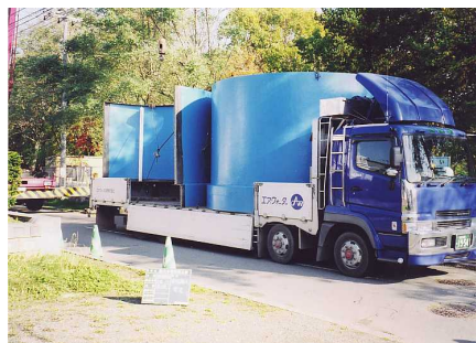
2 - 1 2分割タイプを11トントラックで搬入 状況に応じては4トントラック等でも搬入可