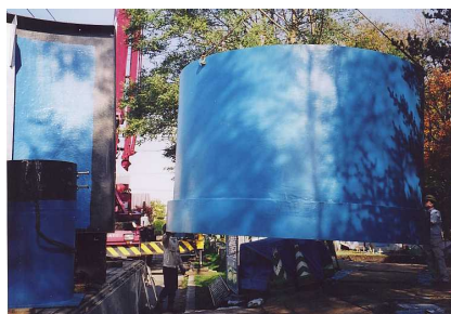
3 - 1 側板吊り降ろし 10～25トンクレーンで作業可