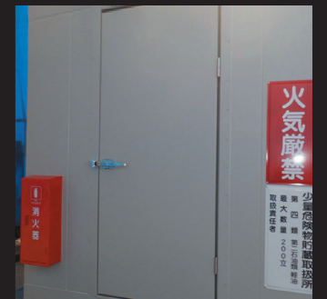
消火器・危険物表示看板