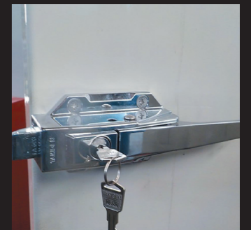
キー付ドアハンドル