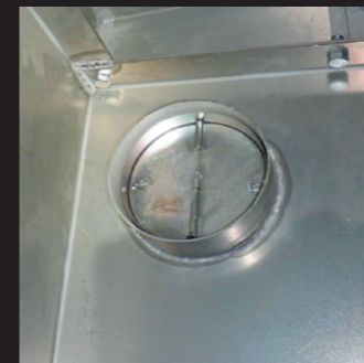
ヒューズ付ダンパー